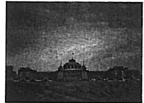
アムステルダム: モーベンピック

スキポール空港より20km、旧市街や鉄道中央駅まで徒歩圏内とアクセスに便利です。アムステルダム港を眼科に望むウォーターフロントホテルです。また、最新のアメニティーを完備しております。